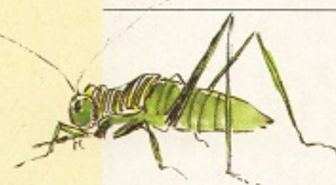
Wiebelt zo grappig met zijn antennes