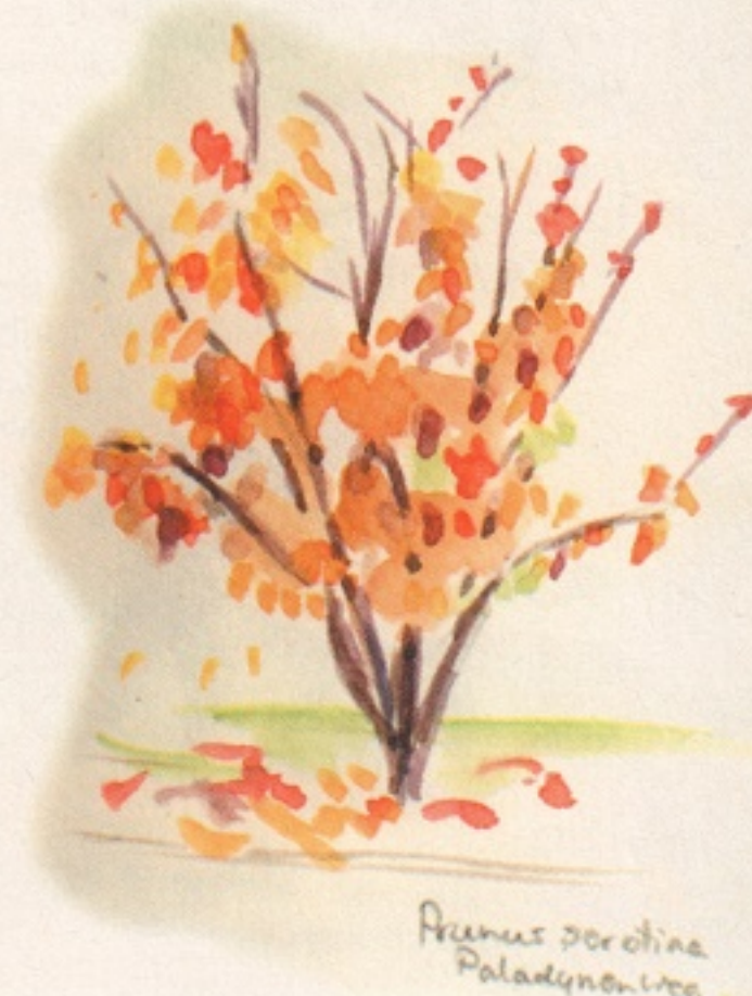
Fraxus excelsior Paladynonweg