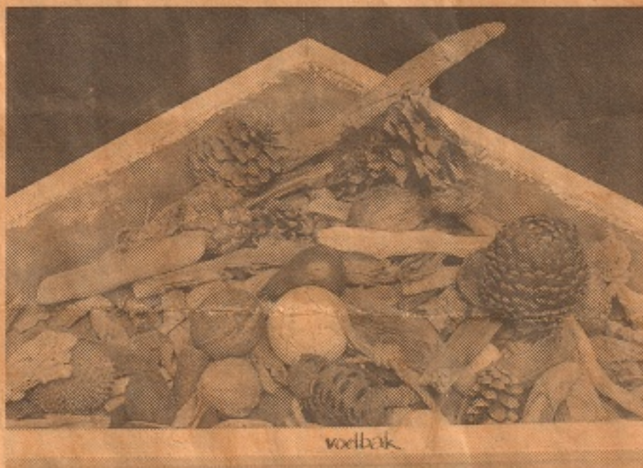
In dit museum mag je dingen aanraken, zoals de spulletjes in deze voelbak.

Het Vindselmuseum zit aan de Neonweg 12 in Amersfoort. Het is elke donderdag-, vrijdag- en zondagmiddag van 13.00 tot 17.00 uur open.